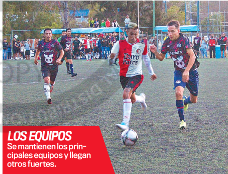
LOS EQUIPOS Se mantienen los principales equipos y llegan otros fuertes.