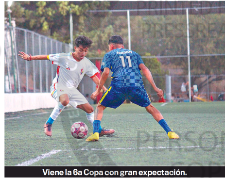
Viene la 6a Copa con gran expectativa.