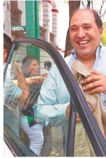
El senador de Morena Cristóbal Arias, acusó al Lázaro Cárdenas Batel (foto) de recibir sobornos de Odebrecht.

quienes tuvieron pactos y recibieron sobornos de Odebrecht y cobijaron a personas